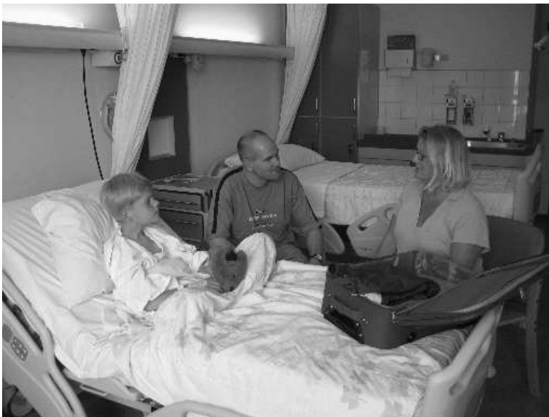
In gesprek met pedagogisch medewerker

Op de kinderafdeling werken kinderverpleegkundigen, verpleegkundigen die de opleiding volgen tot kinderverpleegkundige, en senior verpleegkundigen. Wij streven ernaar uw kind zo veel mogelijk door dezelfde verpleegkundige te laten verzorgen. Welke verpleegkundige voor uw kind zorgt, kunt u zien op het de daarvoor bestemde borden bij de secretaressebalie.